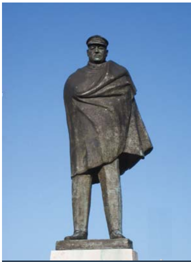
Il monumento a Nazario Sauro sulle rive di Trieste

Noi ragazzi del progetto "Promuovi te stesso" ci siamo chiesti come mai la nostra scuola si chiamasse così. Allora abbiamo deciso di metterci sulle tracce della persona alla quale la nostra scuola fa riferimento, scoprendo aspetti storici molto importanti.