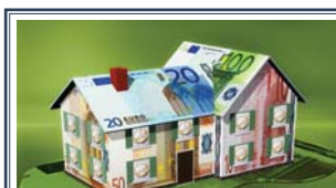
La banca a scuola A pagina 3