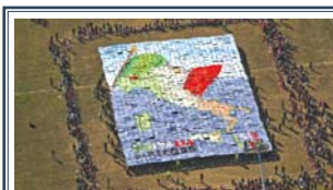
Malnate nel Guinness A pagina 4 e 5