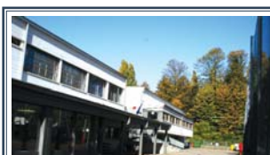
Il nome della nostra scuola A pagina 2