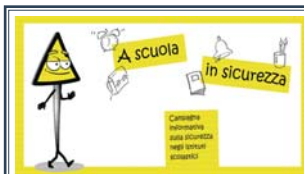
Sicurezza a scuola A pagina 8