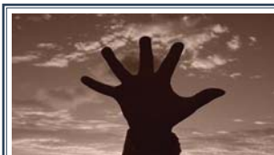
Sos ambiente A pagina 9