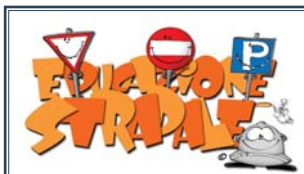
La sicurezza stradale A pagina 6