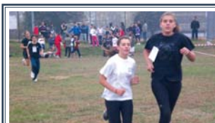
Classifiche corsa campestre A pagina 7