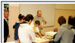
Con le "mani in pasta" A pagina 10 e 11